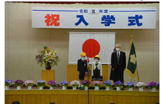
黄色い安全帽を授与された1年生

校長先生やPTA会長さんからお祝いの言葉をいただき、入学した喜びを感じているようでした。「ようこそ是川小学校へ！」